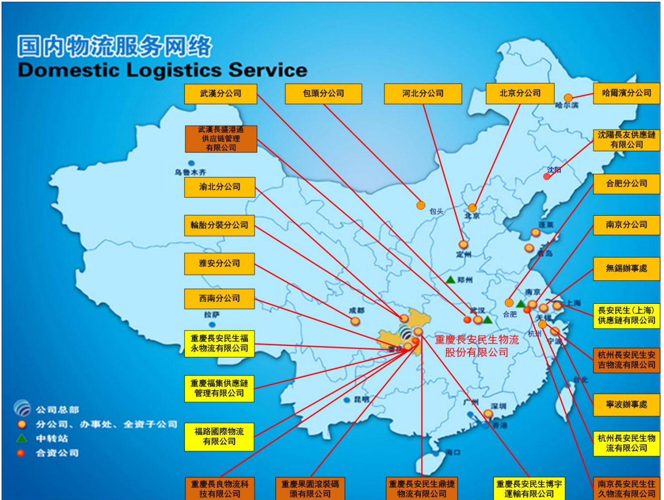
圖二：公司目前的分支機構分佈圖

於 2019 年 12 月 31 日，本公司累計設立分公司、子公司、聯營企業和辦事處 26 個，主要分佈在華東、華中、華北、華南和西南地區（圖二）。不斷完善的服務網絡，令本集團能提供物流服務至全國各地。